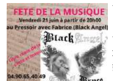
©Fête de la musique au pressoir

www.loeildeprovence.com/39/restaurant-le-pressoir