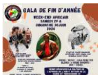
juin espace Fenouil