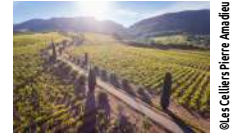
@Les Celliers Pierre Amadiou