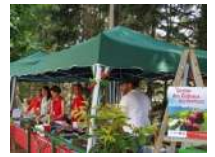
@PNR du Ventoux

☎ 06 14 79 40 13 - 06 81 55 27 55 - 06 81 45 03 12