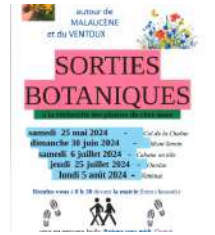
@Apprendre des Anciens