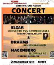
@Concert saint Siffrein