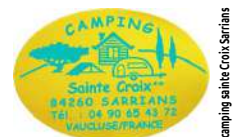
@Marché au camping sainte croix Sarrians

📞 04 90 65 43 72 www.camping-sainte-croix.com/