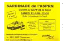
@Comité du CCF84 de Sault