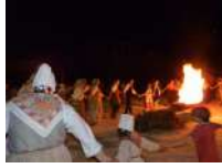
@la roque sur pernes

https://maisondelhistoirelocale.asso-web.com