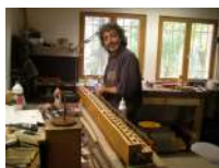
@PNR du Ventoux