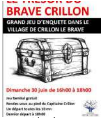
@Association Art & Culture