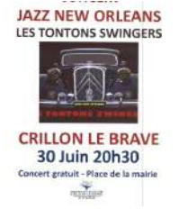
@Association Art & Culture à Crillon-le-Brave