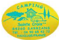
©Marché au camping sainte Croix Sarriaris