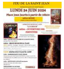
@Feux de la St. Jean Sarrians