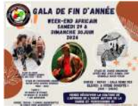
@Rdv Juin espace Fenouil