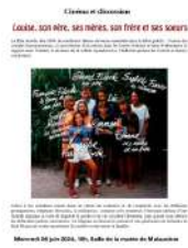
@culture pour tous